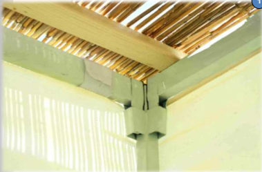
הקשר משמש כמעמיד לסכך ומסגרת המתכת נעשית 'מעמיד דמעמיד'

פסול מעמיד: לכתחילה, אין להשעין את הסכך על גבי דבר הפסול לשמש בעצמו כסכך, כגון מסגרת מתכת וכדו'. כמו כן, אין לתפוס את הסכך שלא יעוף ברוח באמצעות דבר הפסול לסכך בו, כגון אזיקון פלסטיק. אך בדיעבד , מותר להשתמש בסוכה שנבנתה עם מעמיד פסול. 1 [אך ראה להלן בדין 'מעמיד באמצע' שיש אופנים שלדעת כמה פוסקים פסול גם בדיעבד ].